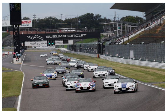
ロードスター・パーティレースIII