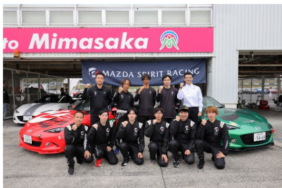
「バーチャルからリアルへの道」参加メンバー (2024年度)

マツダ株式会社(以下、マツダ)は、モータースポーツ文化を未来につなげていくことを目的とした、参加型モータースポーツ活動の2025年度計画を発表しました。マツダは2030年に向け、「ひと中心」の思想のもと人を研究し続け、人々の日常や移動することの感動体験を創造し、誰もが生き生きと暮らす「愉しさ」と「生きる喜び」を届けていくことを目指しています。その実現に向け、2025年度の参加型モータースポーツ活動においても、個々人の技量に応じて、クルマ本来の操る愉しさをモータースポーツで体験する機会を継続して提供してまいります。