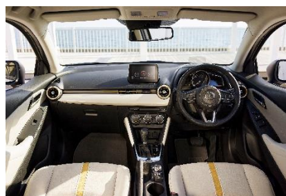
MAZDA2特別仕様車「Sunlit Citrus」 SKYACTIV-G 1.5(高圧縮)、2WD(FF)の内装

今回の商品改良では、エンジン・装備の改良および新外板色の追加を実施しました。また「いつもの運転が前向きな楽しい気持ちになれるクルマ」を目指した特別仕様車「Sunlit Citrus」を追加しました。