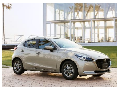
MAZDA2特別仕様車「Sunlit Citrus」 SKYACTIV-G 1.5(高圧縮)、2WD(FF)の外観

マツダ株式会社(以下、マツダ)は、コンパクトカー「MAZDA2」の一部商品改良を行い、特別仕様車「Sunlit Citrus(サンリット シトラス)」を追加し、全国のマツダ販売店を通じて、本日発売します。