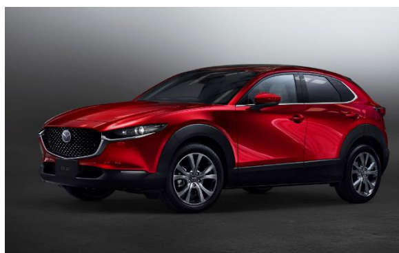
「MAZDA CX-30 X L Package (2WD 車)」

「人生の幅や世界観を広げるクロスオーバー」をコンセプトに開発した CX-30 は、お客さまからは「市街地での取り回しが容易な、丁度よいサイズ」、「デザインと居住性、静粛性・オーディオが高次元でバランスされた、質感の高い室内空間」、「特徴的で美しいエクステリアデザイン」、「運転がしやすく、今までより遠くまで行きたくなる」など、洗練されたスタイリングと機動性・パッケージングを融合した点に、ご支持をいただいております。