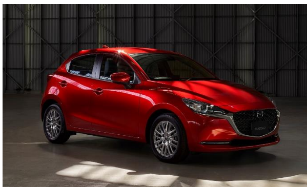
MAZDA2「XD PROACTIVE S Package」(オプション装着車 2 )

マツダ株式会社(以下、マツダ)は、同社の5ドアハッチバック「マツダ デミオ」 1 を、マツダブランドを鮮明化すべく、「MAZDA2(マツダ・ツー)」と車名変更し、新たなデザインと技術を取り入れ、全国のマツダ販売店を通じて本日より予約受注を開始します。発売は9月12日を予定しています。