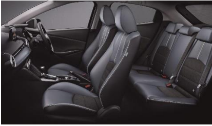
MAZDA2「XD L Package」