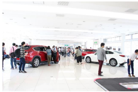
前回のイベントの様様

マツダは、良き企業市民として、社会貢献活動に取り組むために、お客さまをはじめとするステークホルダーの皆さまとの対話を行ってきました。今後も、お客さまとのさまざまな接点を通じて、お客さまの人生をより豊かにし、お客さまとの間に特別な絆を持ったブランドになることを目指してまいります。