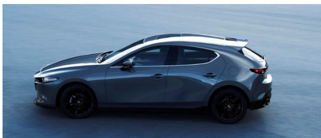
新型「Mazda3 CUSTOM STYLE」(北米仕様車)

マツダ株式会社(以下、マツダ)は、2019年1月11日～13日に幕張メッセ(千葉市美浜区)で開催される「東京オートサロン2019」において、今年11月にロサンゼルス自動車ショーで初公開した新型「Mazda3(北米仕様ベースの用品装着車)」を日本初公開します。